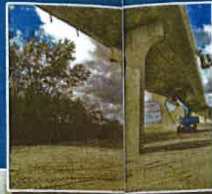
Rabattement pour fouille avec récépage de pieux.