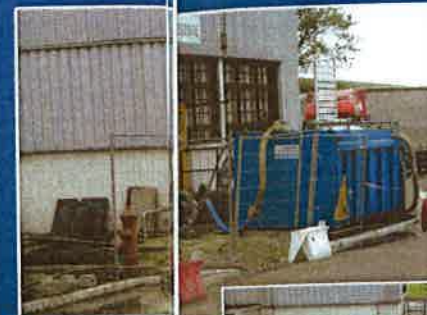
Rabattement de nappe avec dépollution.