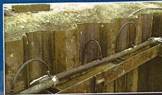
Rabattement de nappe dans fouille blindée. (Génie civil).