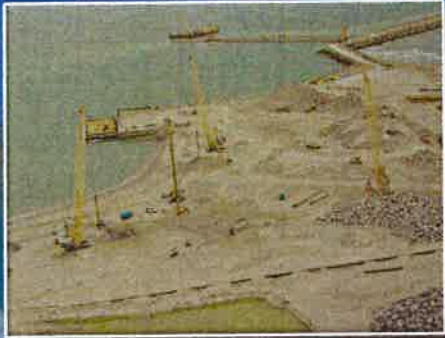
Pompage par pointes filtrantes pour travaux d'amélioration des sols.